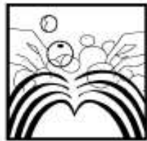
3.按摩头皮3~5分钟,至产生泡沫