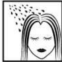
1.同洗发水使用方法相同,先将头发润湿