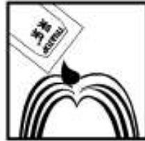
2.将5ml采乐,涂于发根及头发上