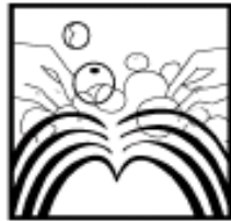
3.按摩头皮3~5分钟,至产生泡沫