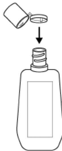
用内侧的突起按住薄膜,用力压出一孔,即可使用。