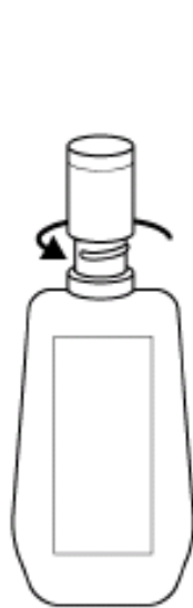
逆时针拧下塑料瓶口