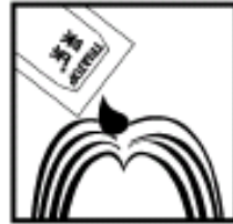
2.将5ml采乐,涂于发根及头发上